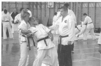
A magyar nihon tai jitsu és nihon ju jitsu egyesület 2005. évi nemzetközi edzőtáborában