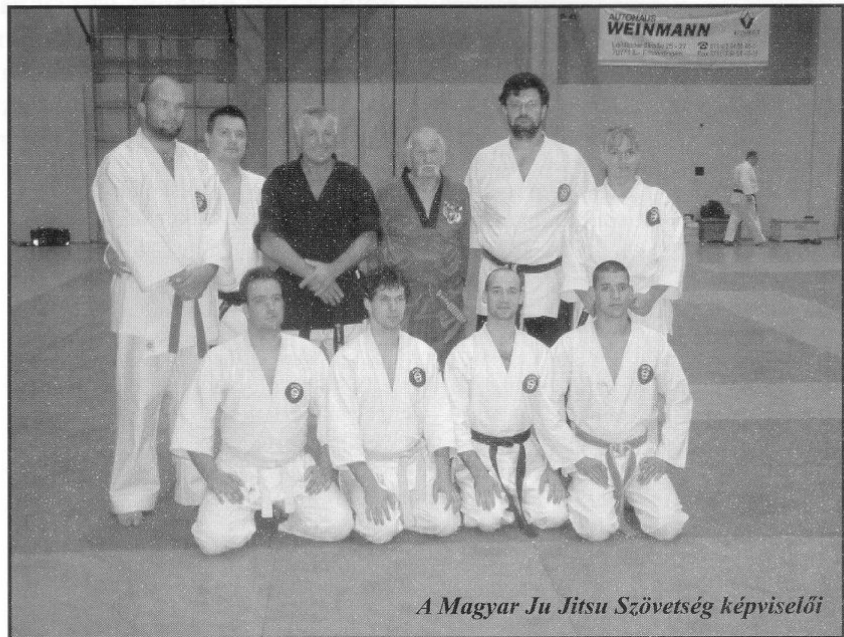
A Magyar Ju Jitsu Szövetség képviselői

A mozgalmas napot az egyik helyi étteremben, közel 100 fő részvételével szervezett születésnap buli zárta. Itt nyílt alkalom arra, hogy mindenki átadhassa ajándékait a 77 éves jitsu legendának. Günter Painter egy hosszában egy vágással kettévágott nádat adott, ami azt bizonyítja, hogy a soke hosszú életű lesz. A magyar csapat